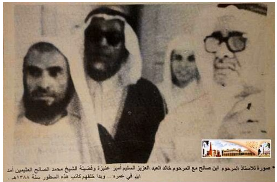
صورة للأستاذ المرحوم ابن صالح مع المرحوم خالد العبد العزيز المسلم أمير عزيزة وفضيلة الشيخ محمد الصالح العثيمين أمد الله في عمره . . وبدا خلفهم كاتب هذه المنطور سنة ١٣٨٨ هـ .

رسالة ابنها رسالة عزيزة المعهد العلمي بأبها ابها - من محمد سرحان عين فضيلة الأستاذ الجليل محمد الصالح العثيمين اماما لجامع عزيزة الكبير متوليا لتدريس حلقات العلم فيه ، خلفا لفضيلة أستاذه الشيخ المرحوم عبدالرحمن الناصر السعدي والجدير بالذكر ان الأستاذ العثيمين على جانب عظيم من الثقافة الشاملة اذ هو - في نفس الوقت - أستاذ محترم بالمعهد العلمي ومشرف م. شول على ناديه الثقافي وطالب بجد بكافة الشريعة في الرياض . وفى الله فضيلته الخير وسدد خطاه . افتتح في ليلة الاثنين ٢٦ - ٦ ١٣٧٦ هـ في الساعة الثانية والنصف بمدينة ابها معهد المعلمين الليلي . والواقع ابها أمنية تحققت طالما تشوقت النفوس اليها وظل الكثير يحلم بها حتى أصبحت بفضل الله ثم بفضل المسؤولين حقيقة مدلوسة . وحق لنا أن نقول اننا فلنا ما كنا وكان لوطن في أمس الحاجة اليه ؛ فهذا المعهد يسهم بدور جليل في تنمية ثروة المعلمين العلمية والهوض ليس الأرض مواتة في جانبها خيمة المأمور التي لا تنسع لأكثر أثنين معه ، وحيث أنه قد مضى على تلك الأرض ما به يدعى السنين . هي - هي منذ بكرة أول يوم منها اتبعني بالمطار فانا ترفع رجلا . نا الحار الى مقام سمو وزير لدفاع والطيران المعظم ليحقق لمطارتنا مرافقه الضرورية اللازمة . عاجلا . بحيث يصبح سما على مسمى في البلد . ببناء مكتب له يحفظ الاثاث و يبقى من يؤمه ضرر البرد في مثل هذا الفصل و ضربات الشمس ولنا في سموه أمل وطيد . قدوم قدم بطريق الجو السيد عبد الله السعدي تجل فقيد الدين المرحوم عبدالرحمن الناصر السعدي . الأكرم